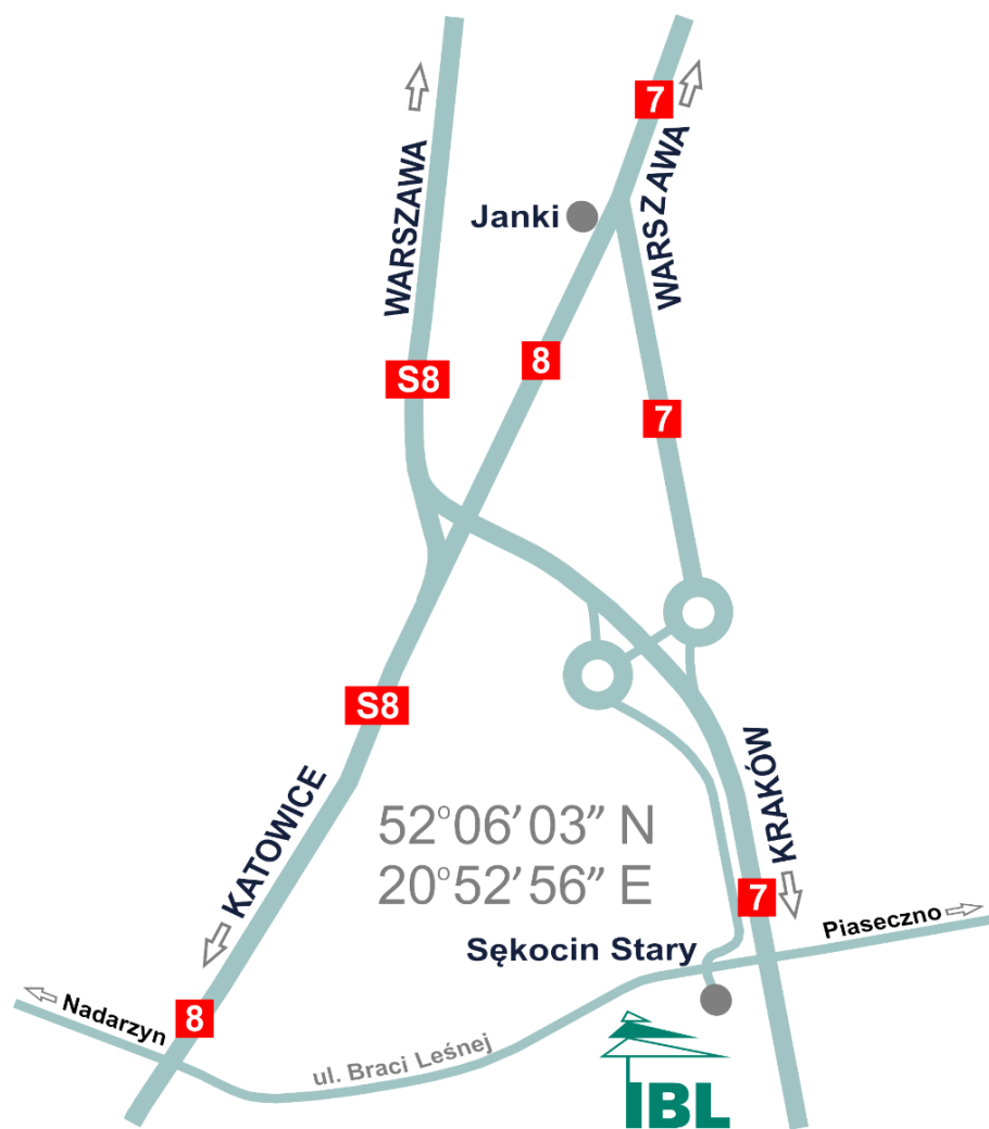
Plan dojazdu do IBL w Sękocinie Starym, ul. Braci Leśnej 3