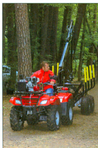
„Interaktywna” prezentacja sprzętu do zrywki i podwozu drewna.