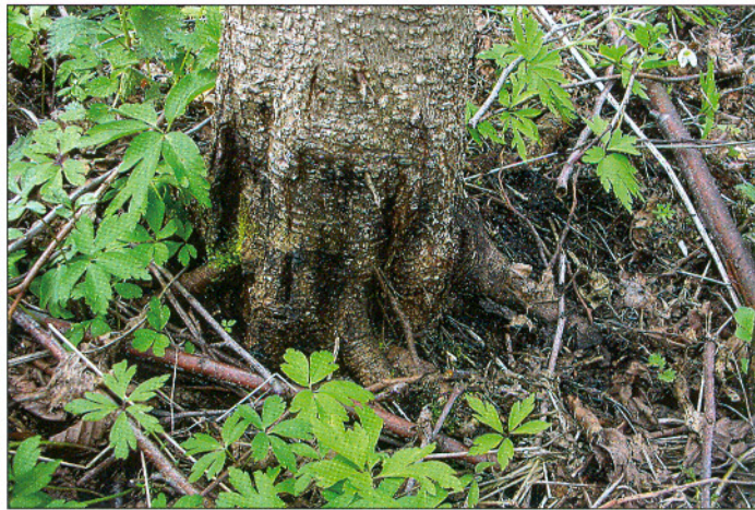
Pęknięcia kory połączone z wysiękami jako efekt porażenia młodej olszy przez Phytophthora alni .

Podsumowaniem tych interesujących wyników badań było ogólnopolskie seminarium nt. „Nowych inwazyjnych gatunków Phytophthora – jako zagrożenia szkółek i drzewostanów” zorganizowane przez Instytut Badawczy Leśnictwa. Wśród 321 uczestników spotkania byli przedsta-