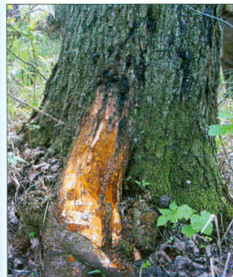
Prawie całkowicie martwy nabieg korzeniowy w wyniku infekcji Phytophthora alni . Widoczne są ciemne wysięki na pniu kilkudziesięcioletniej olszy (jasne plamy – żywa tkanka, ciemnobrązowe – martwa).