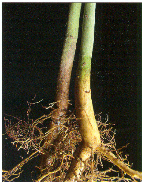
Korzeń sadzonki jesionu wyniosłego zaatakowanej przez Phytophthora citricola (z lewej). Obok – egzemplarz zdrowy.

Sprzyjające warunki pogodowe do rozwoju fitoftorozy są czynnikiem decydującym o konieczności stałego monitorowania procesu zamierania gatunków drzew liściastych. Ma to szczególne znaczenie w realizacji idei trwałego i zrównoważonego rozwoju lasu i leśnictwa. Zauważyć należy bowiem, że fitoftoroza jest kolejnym patogenem rozprzestrzeniającym się w krajach Europy, gdyż wcześniej podobne zja-