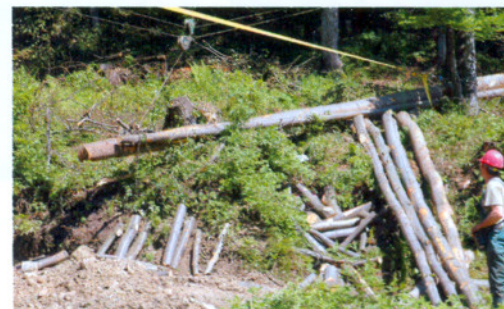
Pokaz zrywki drewna wciągarką linową

wa tego sektora to niewątpliwie jedno z zadań warunkujących rozwój leśnictwa w kraju.