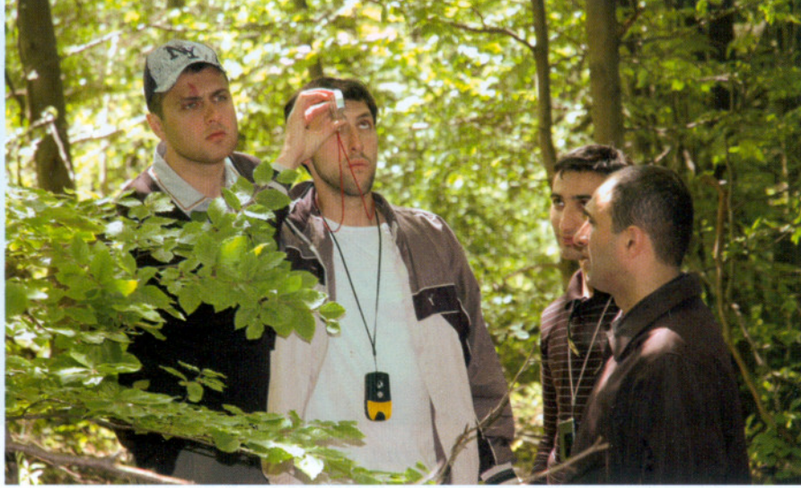
Prezentacja wyposażenia leśniczego – pomiar wysokości drzewa

Racza to region położony na północy kraju, na stokach Wielkiego Kaukazu. Stąd bierze swój początek jedna z dłuższych rzek Gruzji – Rioni. W krajobrazie dominują góry, nierzadko przekraczające wysokość 3000 m n.p.m. Lesistość regionu, w którego skład wchodzi okręgi Ambrolauri i Oni, wynosi około 57 proc. i znacznie przewyższa lesistość kraju (około 40 proc.). Powierzchnia leśna obu okręgów sięga nieco ponad 140 tys. ha, z czego 103 tys. ha zajmują lasy gospodarcze, a 37 tys. ha zostało wyłączonych na stałe z użytkowania; w niedalekiej przyszłości obszar ten wejdzie w skład planowanego parku narodowego.