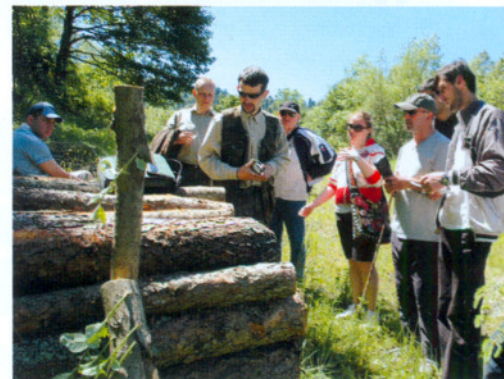
W leśnictwie Buk

lasu regionu Racza (okręgów Oni i Ambrolauri). Z pomocą miejscowych leśników poznano najważniejsze typy lasów w regionie. Polacy brali też udział w pomiarach wybranych drzewostanów w celu weryfikacji planu. Istotnym elementem pobytu w Gruzji było spotkanie z przedstawicielem firmy, która wykupiła licencję na użytkowanie około 630 ha lasów w Raczy, oraz zebranie informacji o kosztach pozyskania drewna i jego obróbki. Ciąg technologiczny i zasady sprzedaży polskim gościom przybliżono w należącej do licencjodawcy tartaku w Oni, drugim największym mieście regionu. Produkowany tu surowiec jest niemal w 100 proc. eksportowany za granicę, m.in. do Turcji i Izraela. W całej Gruzji brakuje bowiem dużych zakładów produkujących meble, papier bądź stolarkę drewnianą. Budo-