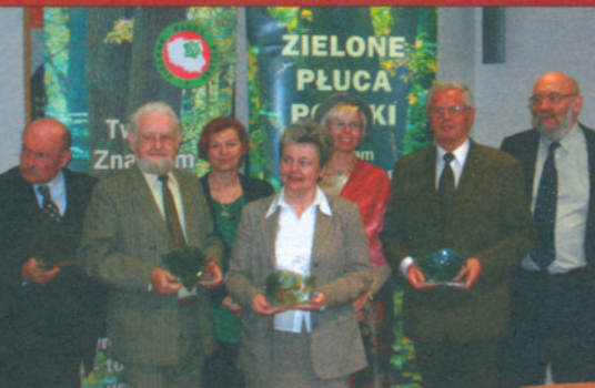
Wspólne zdjęcie laureatów ostatniej edycji Nagrody Zielonego Liścia i członków Kapituły jej przyznania

Prestiżowa Nagroda Zielonego Liścia im. Profesora Stefana Kozłowskiego za działalność na rzecz ekorozwoju obszaru funkcjonalnego Zielone Płuca Polski została wręczona pod koniec ubiegłego roku w Banku Ochrony Środowiska czterem laureatom.