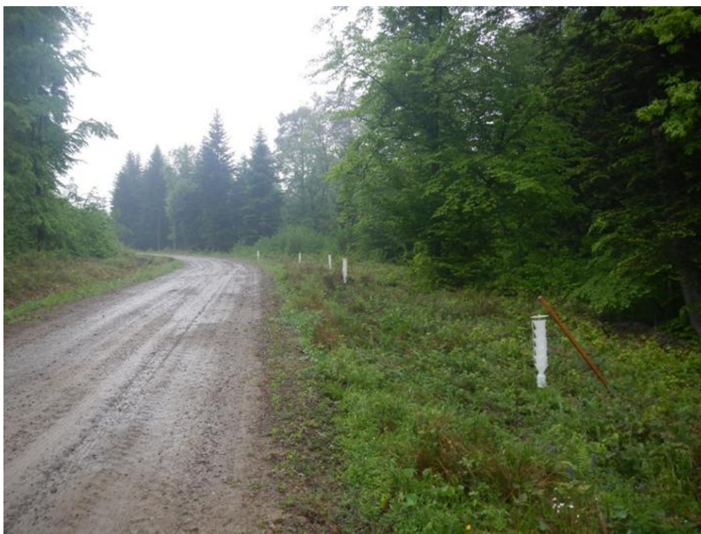
Rycina 1. Pułapki feromonowe IBL-3 do odłowu chrząszczy X. germanus eksponowane na terenie Nadleśnictwa Krasiczyn, Leśnictwa Kormanice (wydz. 85c)

Figure 1. IBL-3 traps baited with attractants for capturing X. germanus beetles placed in the Krasiczyn Forest District, Kormanice Subdistrict (comp. 85c)